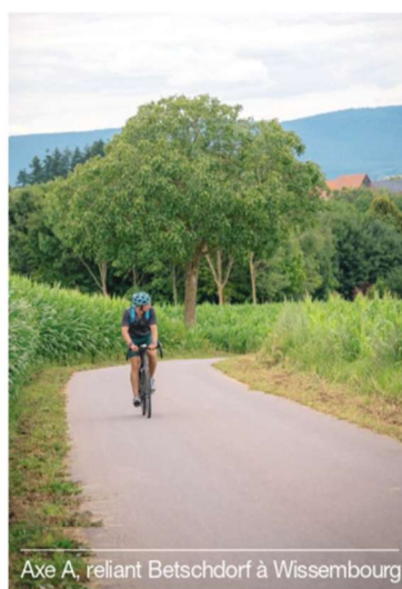
Axe A, reliant Betschdorf à Wissembourg

Des travaux ambitieux qui représentent un investissement conséquent, avec un coût de 2,8 millions d'euros pour l'Axe A et 2,2 millions d'euros pour l'Axe B, soutenus à hauteur de 50% par la Collectivité.